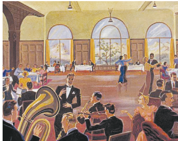
Salonorchester im ersten Prospekt des Hotels Walther, Pontresina

Die Salonkonzerte finden jeweils von 10.30-11.30 h in der Dorfkirche St. Moritz statt.